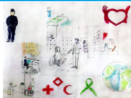
Œuvre présentée par le club La Baule Côte d'Amour Collège Saint Joseph d'Herbignac