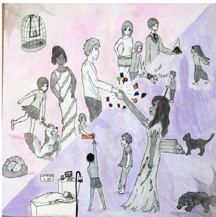
Affiche lauréate du District présentée par Trégor Côte de Granit Rose