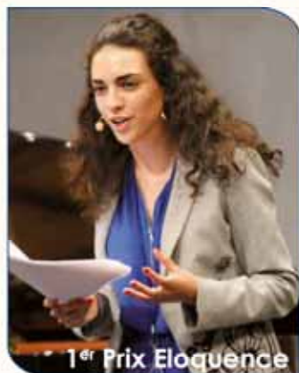
1 er Prix Eloquence