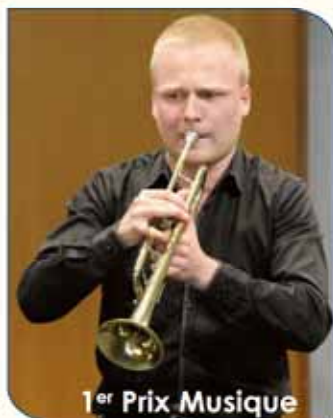
1 er Prix Musique