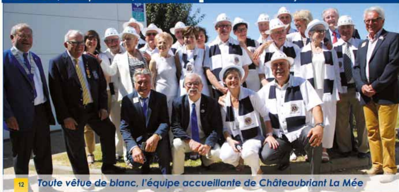
Toute vêtue de blanc, l'équipe accueillante de Châteaubriant La Mée