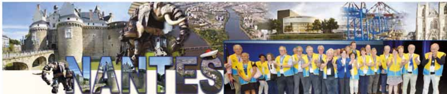
Une partie de l'équipe organisatrice et bénévoles

Voilà encore pour le rayonnement de notre District 103 Ouest !