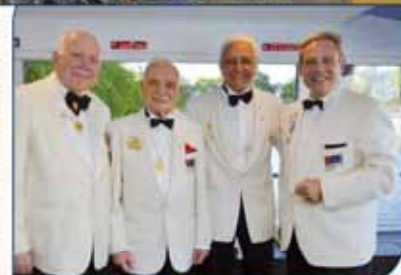
Conseil des Gouverneurs 2016-2017

Puis, il nous a fallu déterminer et organiser les équipes autour de personnalités solides et efficaces. J'ose dire que les choix que nous avons fait, se sont avérés très appropriés, même si parfois le bateau a tangué, et comment pouvait-il en être autrement, avec des hommes et des femmes au caractère bien trempé, confrontés à un défi de la taille de ce qui nous était demandé et que personne n'a jamais sous-estimé, au contraire.