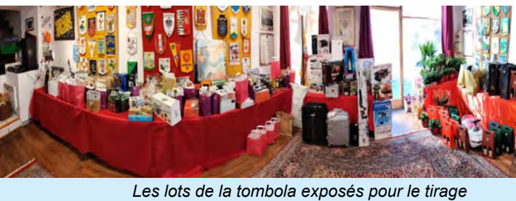
Les lots de la tombola exposés pour le tirage

Samedi 12 février, dans le salon du Club-house de La Flèche, il a été procédé au tirage électronique des 357 lots disponibles ceci grâce à un ingénieux logiciel indiscutable pour les résultats et en quelques minutes seulement.