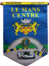
Le mans centre