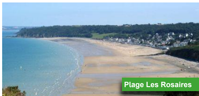
Plage Les Rosaires

Il manquait quelques degrés de l'air et de l'eau pour profiter de la marée haute sur la plage des Rosaires qui a permis de profiter de la baie. Deux journées décontractées appréciées par les accompagnants avec de surcroît une gastronomie à la hauteur.