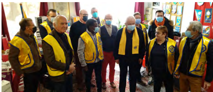
Baugeois et Fléchois lors du tirage

Ce sont 3500 billets qui ont été mis en vente dès le mois de décembre 2021 et 357 lots ont pu être rassemblés grâce à la générosité des commerçants, artisans et entreprises de la région. S'y ajoutent des dons en espèces de la part de donateurs fidèles et/ou sensibles à notre action.