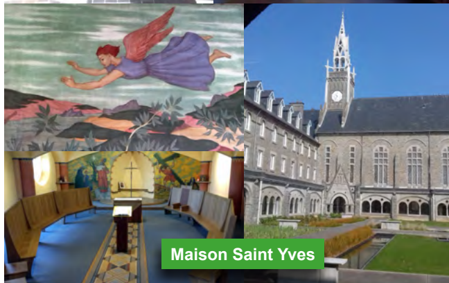
Maison Saint Yves

Il manquait quelques degrés de l'air et de l'eau pour profiter de la marée haute sur la plage des Rosaires qui a permis de profiter de la baie. Deux journées décontractées appréciées par les accompagnants avec de surcroît une gastronomie à la hauteur.