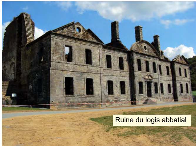
Ruine du logis abbatial

Sur les bords du canal de Nantes à Brest, découvrez l'abbaye de Bon-Repos construite par Alain III de Rohan au cœur de la forêt de Quénécán. Après des siècles de prospérité, cette abbaye cistercienne connut des périodes de renaissance alternées de périodes de crise. À la Révolution, l'abbaye fut vendue comme bien national et tomba en ruines avant de revivre grâce aux Compagnons de Bon-Repos.