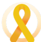
le cancer pédiatrique