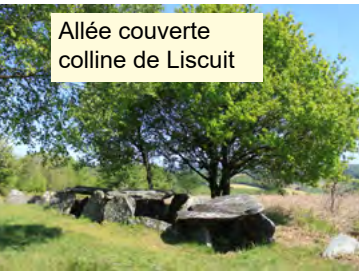
Allée couverte colline de Liscuit

Depuis Pontivy, centre de ce pays, vous pourrez ainsi découvrir 5000 ans d'histoire depuis les sites préhistoriques incontournables et plusieurs monuments mégalithiques, dolmens, menhirs et allées couvertes ou tumulus sont toujours visibles sur le territoire.