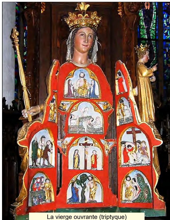
La vierge ouvrante (triptyque) Chapelle Notre Dame de Quêlven Guern