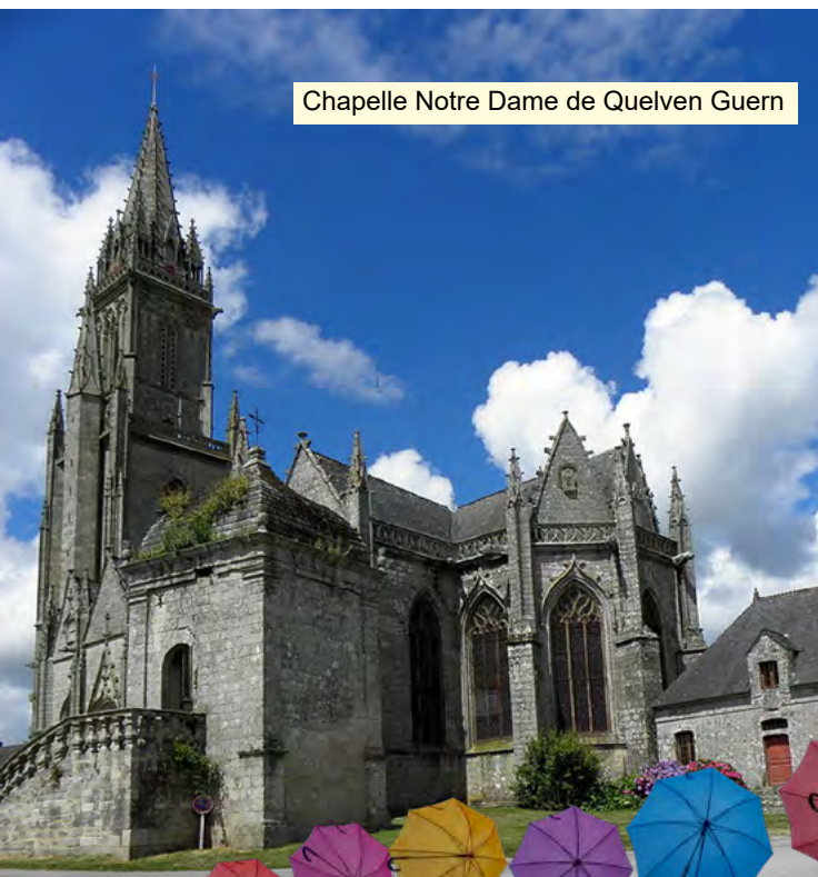
Chapelle Notre Dame de Quêlven Guern

On pourrait croire que l'eau coule à Pontivy sans que l'on y trouve art qui vive. Pourtant, le Centre Bretagne recèle de nombreux trésors architecturaux du patrimoine religieux et surtout l'expression de la ferveur populaire ainsi que sur les murs intérieurs et extérieurs de ces chapelles et édifices que l'on découvre dans le centre des villes, villages et hameaux et également au détour d'un chemin de campagne.