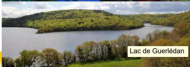
Lac de Guerlédan

La diversité du patrimoine légué par la famille des Rohan est une des grandes richesses de notre territoire. Avec la création de la première imprimerie de Bretagne en Bréhan et des Forges des Salles en Sainte-Brigitte, les Rohan développèrent l'industrie. Leurs liens avec l'Église furent à l'origine de la création de l'abbaye de Bon-Repos, et d'une multitude de chapelles telles Notre-Dame de Bonne-Encontre à Rohan, le Gohazé à Saint-Thuriau, la Trinité à Cléguérec et Notre-Dame