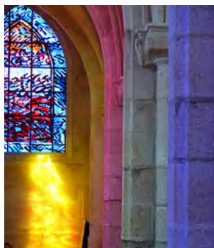
Jeu de lumière vitraux, église Saint Joseph Pontivy

Pontivy et sa région sont le cœur d'une initiative culturelle digne d'intérêt. Chaque été, l'art contemporain s'invite dans une vingtaine de chapelles jalonnant la vallée du Blavet, véritables bijoux du patrimoine nichés en pleine campagne. L'occasion pour des artistes plasticiens d'imaginer des œuvres très originales spécialement créées en fonction de ces édifices religieux, datant pour la plupart des XV ème et XVI ème siècles. Une balade idéale pour les amateurs d'insolite, avec le mystère de la création artistique comme fil conducteur.