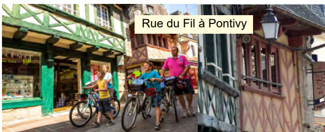
Rue du Fil à Pontivy

La diversité du patrimoine légué par la famille des Rohan est une des grandes richesses de notre territoire. Avec la création de la première imprimerie de Bretagne en Bréhan et des Forges des Salles en Sainte-Brigitte, les Rohan développèrent l'industrie. Leurs liens avec l'Église furent à l'origine de la création de l'abbaye de Bon-Repos, et d'une multitude de chapelles telles Notre-Dame de Bonne-Encontre à Rohan, le Gohazé à Saint-Thuriau, la Trinité à Cléguérec et Notre-Dame de la Houssaye en Pontivy. Le manoir du verger en Noyal-Pontivy et le château de Pontivy rappellent leur puissance politique.