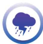
aide aux victimes de catastrophe