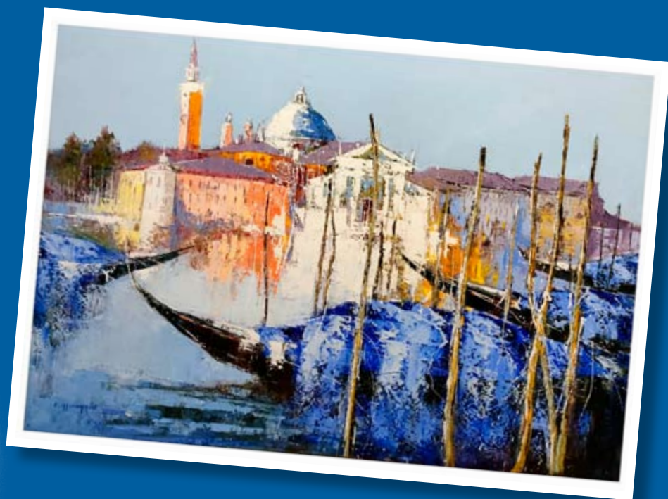
Lumière Matinale à Venise Célestin MESSAGGIO