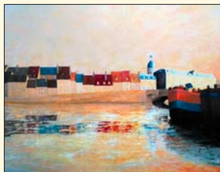
Coucher de soleil - André Gambut