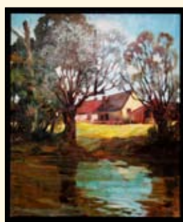
Promenade à Nogent** Jean Porte